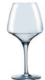
⑥ プロ・テイスティング32 U1008 (6個入)

ページコード 商品コード 価格 4-1461-0501 7160502 ¥15,900 φ72×H234 200cc シャンパンやスパークリングワインは、このタイプのグラスで香りが開きます。グラスの膨らんでいる部分まで注ぐと、上部の面積の大きい部分で空気と触れあい、十分につぼんだリムによってアロマが完全に凝縮されます。フルボトル1本がちょうど6杯分注げます。