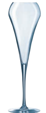
⑤ エフェヴァセント20 U1051 (6個入)

ページコード 商品コード 価格 4-1461-0401 7160011 ¥16,500 φ105×H233 550cc 力強いタンニンをもつワインにたくに適合しています。やや大ぶりなリムがつぼんでおり、カベルネソービニオンやメルローなど若いワインの豊かなアロマを引き出されます。