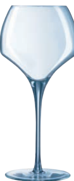
④ タニック55 U1013 (6個入)

ページコード 商品コード 価格 4-1461-0401 7160011 ¥16,500 φ105×H233 550cc 力強いタンニンをもつワインにたくに適合しています。やや大ぶりなリムがつぼんでおり、カベルネソービニオンやメルローなど若いワインの豊かなアロマを引き出されます。