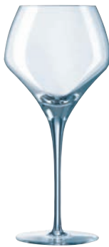
② ユニバーサル・ テイスティング40 U1011 (6個入)

ページコード 商品コード 価格 4-1461-0101 7160302 ¥15,600 φ95×H211 370cc 辛口白ワインの個性を十分に発揮するグラスです。特にシャルドネでは、この品種の特徴である新鮮なバターを思わせるアロマを十分に堪能することができます。