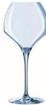
③ ソフト47 U1012 (6個入)

ページコード 商品コード 価格 4-1461-0201 7160202 ¥15,900 φ89×H231 400cc ボールが長めのグラスは、ややつぼんだリムでアロマを凝縮し、あまりタンニンや酸味の強くない赤ワインやソーベニヨンブランなどの白ワインなどを味わうのにオススメです。